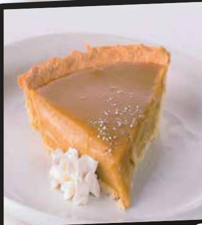
Tarte au sucre