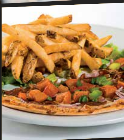
Pizza demi frites