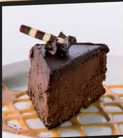
Croustillant au chocolat