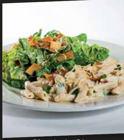
Pâtes demi et César