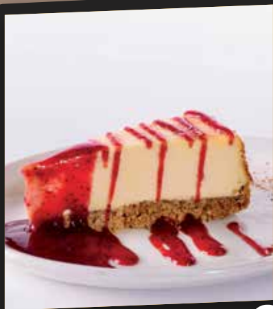
Gâteau au fromage