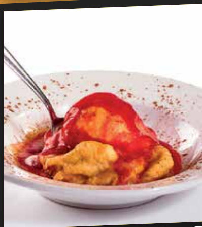
Crème glacée chaude